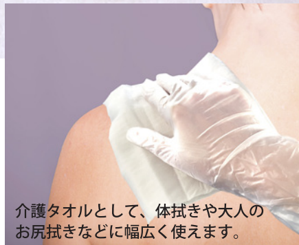
介護タオルとして、体拭きや大人のお尻拭きなどに幅広く使えます。

素材: レーヨン・PET 不織布 (厚手) 成分: プチルカルバミン酸ヨウ化プロピニル ベンザルコニウムクロリド、水 保湿成分: アミノ酸系湿潤剤 (PCA-Na)