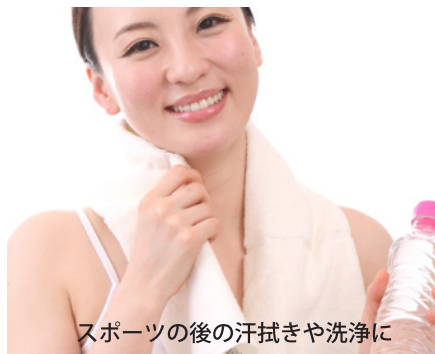
スポーツの後の汗拭きや洗浄に