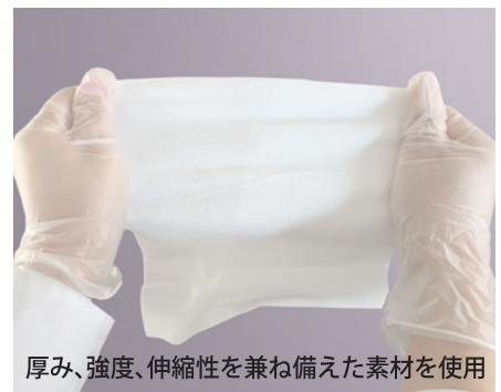
厚み、強度、伸縮性を兼ね備えた素材を使用