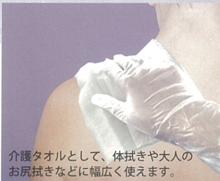
介護タオルとして、体拭きや大人のお尻拭きなどに幅広く使えます。