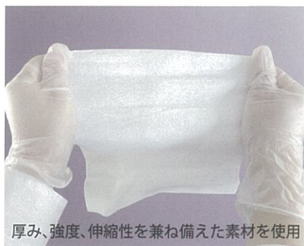
厚み、強度、伸縮性を兼ね備えた素材を使用