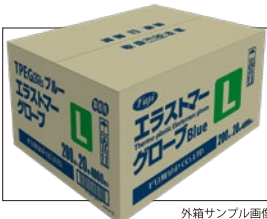
外箱サンプル画像